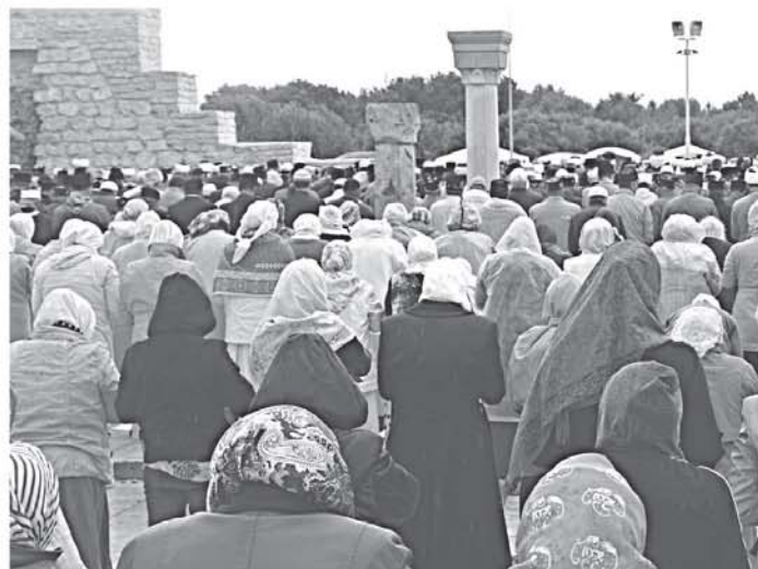
Өйля-намаз в Исторической Джамиг-мечети

Обращаясь к собравшимся Шейхуль - ислам говорит: