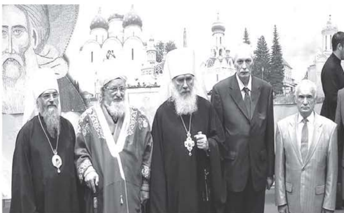
В Уфе 19 июня состоялся форум “Радость Слова” и православная выставка “Табынская”.